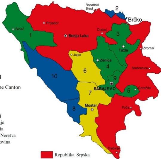
Federation of BiH

Instytucje BiH na poziomie państwa odpowiadają za politykę zewnętrzną, handel zagraniczny, politykę celną, wojsko, politykę monetarną. Odpowiedzialność co do inwestycji w rolnictwie, turystyce, dostarczeniu zasobów naturalnych, przesył – to już sprawy kantonów w Federacji.